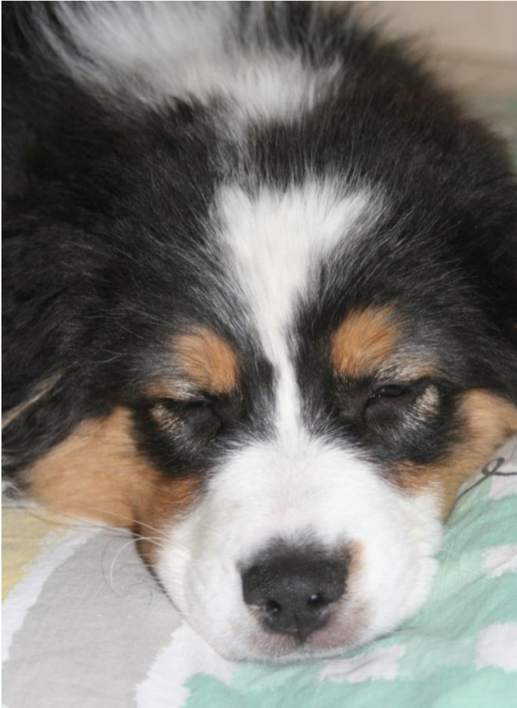
Bald ist der Winterschlaf vorbei!