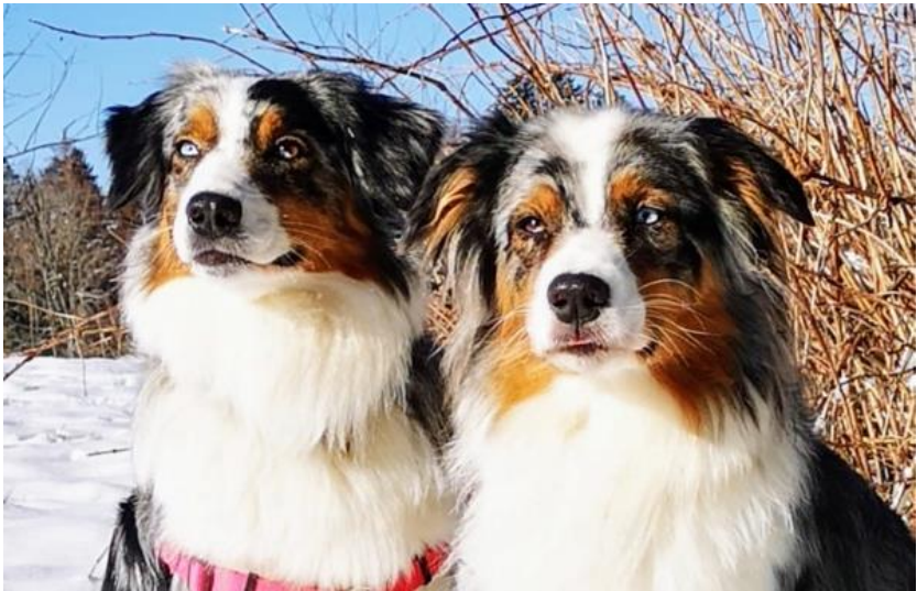
Los Perros Locos