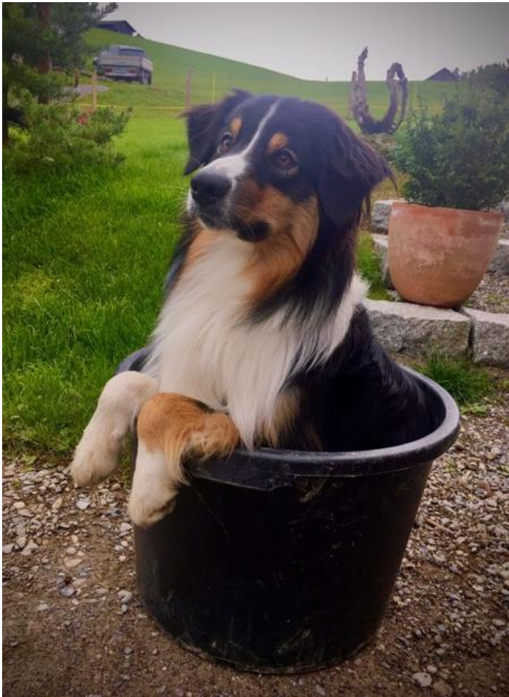
Los Perros Locos Make Things Funnier Sein Name ist Programm!