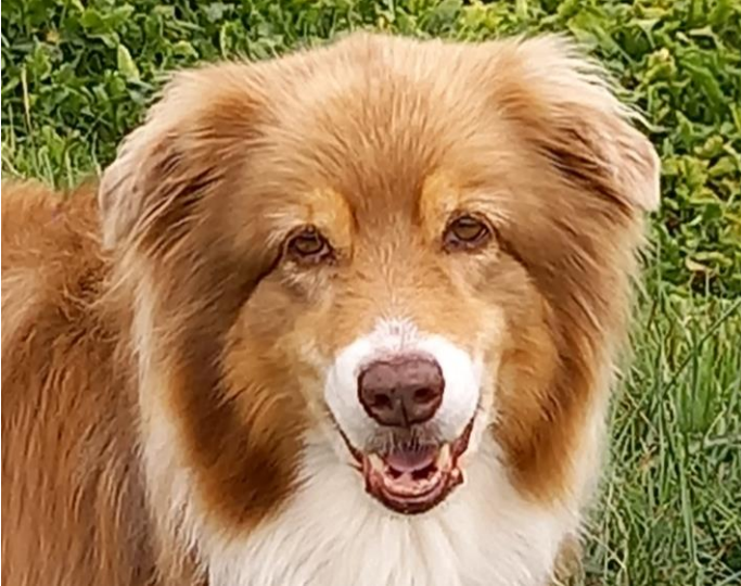
Louve vom Moosquell