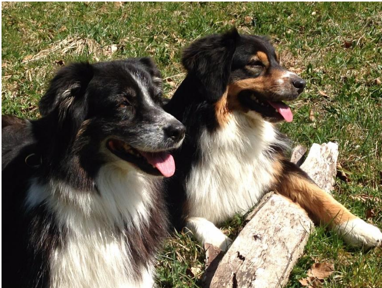
Anu Aileen und Dex Dasha from ColorGang